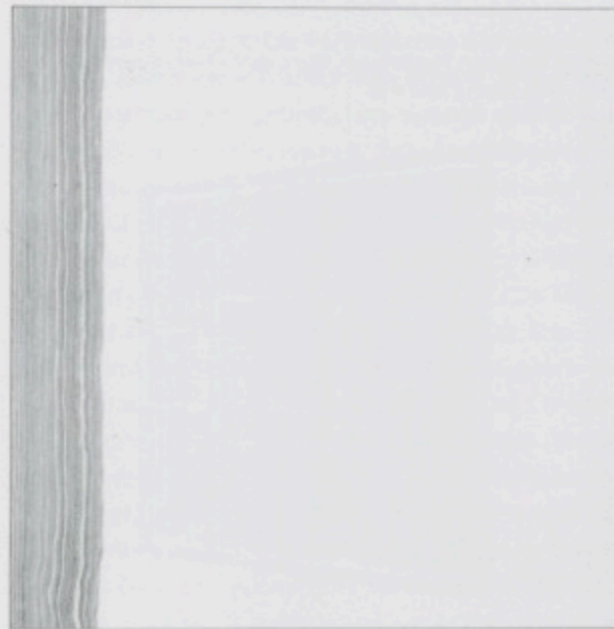
Abb. 33. Leszek Brogowski, Painting Action, seit 1981, Acryl auf Leinwand, Abb. 1988.

were to see any of my paintings off the wall, they would not make any sense at all“ (R. Ryman). 58 Ryman malt „inside the white cube“, innerhalb des weißen Raumes der Galerie. Dieses Weiß ist sein eigentliches Medium. Durch das Weiß wird das Bild zur Nullfläche.