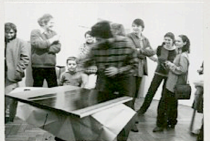
Pinna 20/26 m. 4, Warszawa