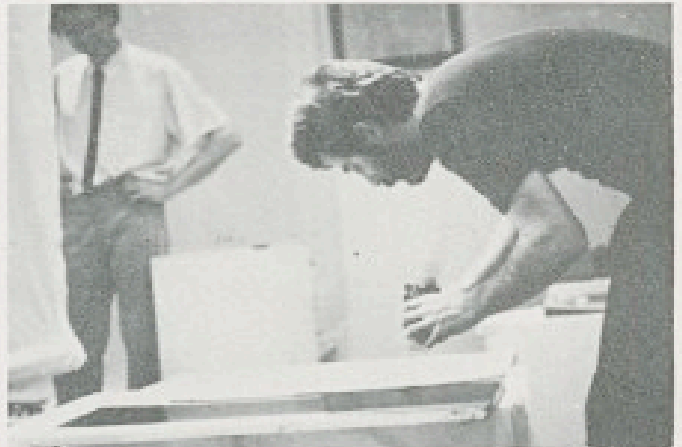
Galerie Alain Oudin, Paris 1983