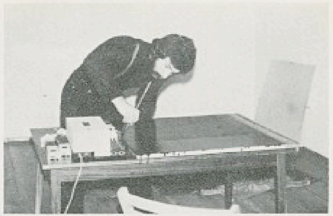
Galeria ON, Poznań 1983